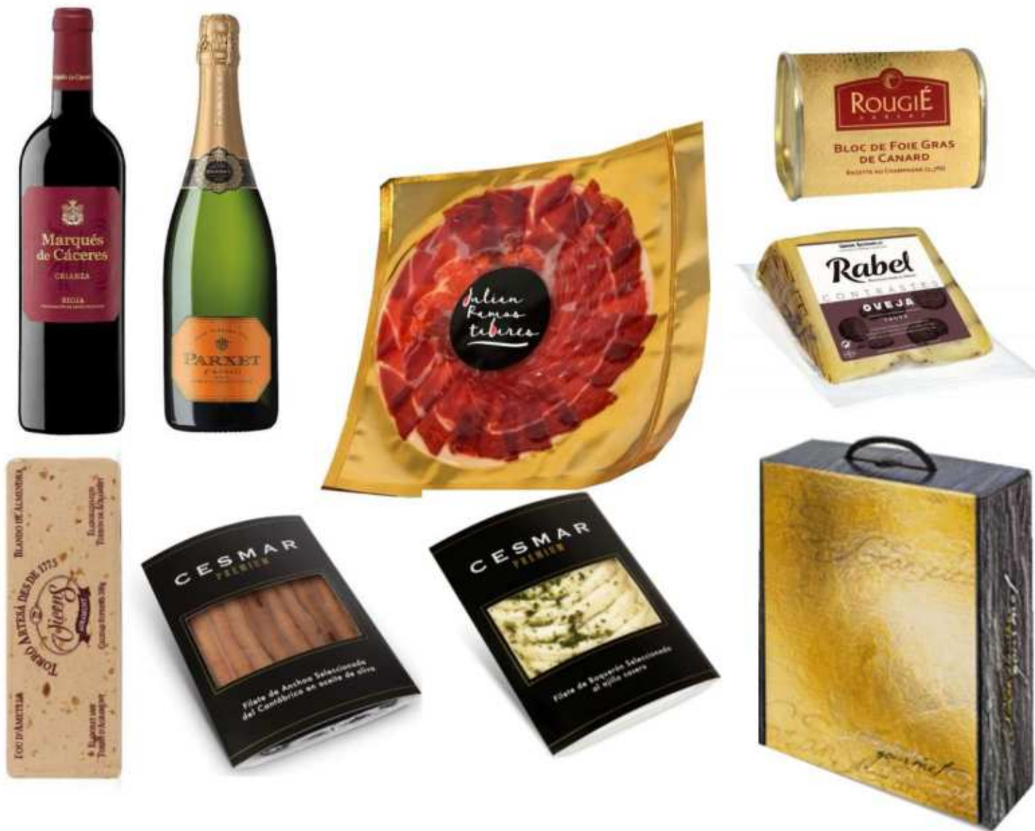
1ut Vi Negre Marques de Caceres 75cl